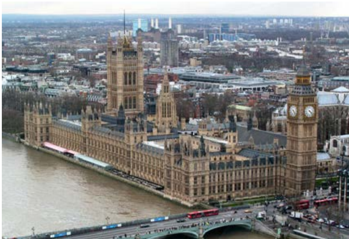
El Palacio de Westminster en Londres alberga la icónica Torre Elizabeth, popularmente conocida como Big Ben. Este famoso nombre, en realidad, se refiere a la enorme Gran Campana que se encuentra dentro de la torre del reloj, no a la torre en sí.

Imaginé la pompa y la circunstancia que se habían desarrollado allí a lo largo de los años, un marcado contraste con la belleza tranquila del parque. Londres, incluso en el primer día, ya había revelado su encanto multifacético: historia antigua, modernidad bulliciosa y rincones inesperados de tranquilidad.