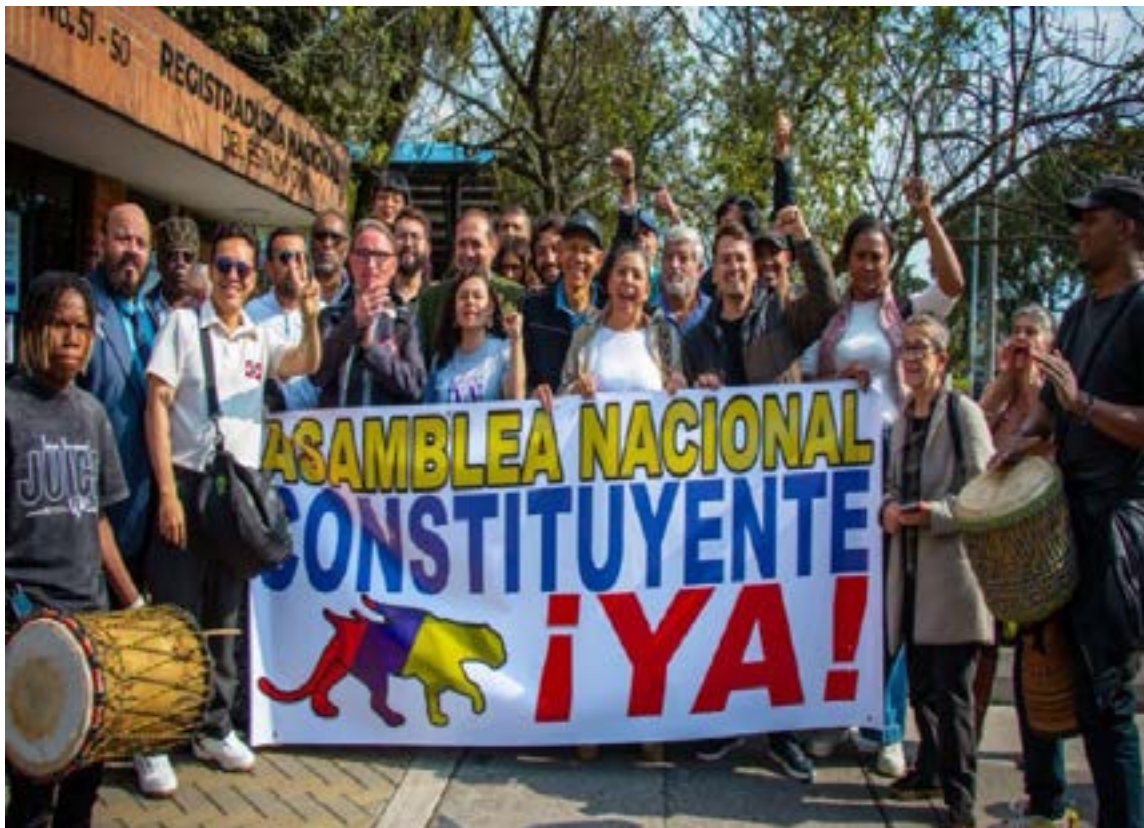
La Registraduría encontró que la inscripción del comité promotor de la iniciativa respaldada por el Gobierno cumple con los requisitos formales.

Aunque la pauta favorece sistemáticamente su imagen, ambos candidatos