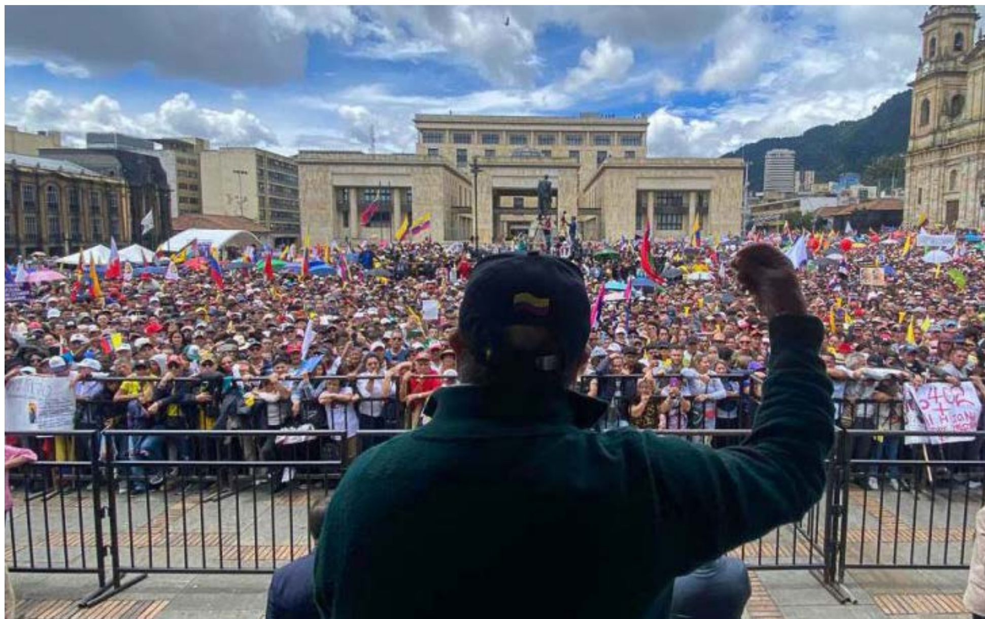
El presidente Gustavo Petro, estará al frente de la movilización en la Plaza de Bolívar