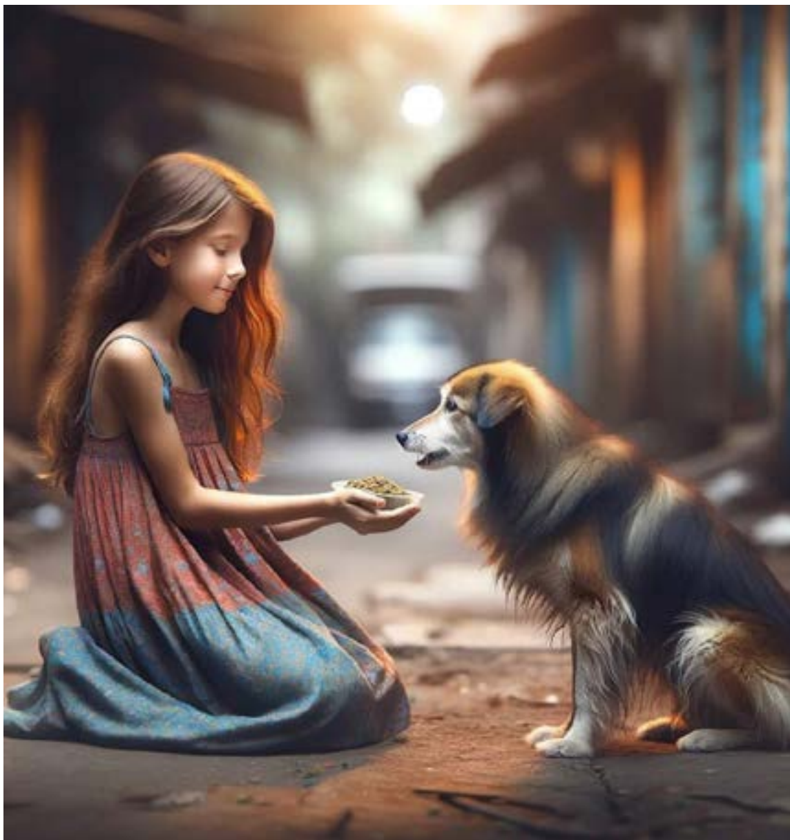
Gratitud con humildad

A lo largo de mi vida, he tenido el privilegio de convertir mis diferencias en mi mayor fortaleza. He aprendido que cada elemento de innovación, cada idea fuera de lo común me ofrece una mejor calidad de vida. Sin embargo, esto no sería posible si no hubiera desarrollado la capacidad de